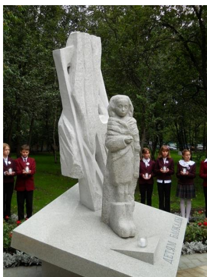
Памятник детям блокады

Посетите с детьми памятные места в городе, посвященные детям блокады.