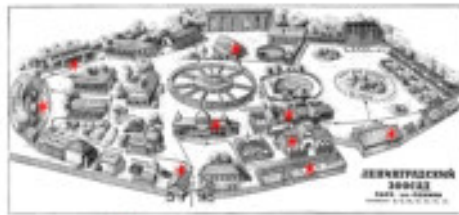
★ МЕСТА ПОПАДАНИЙ БОМБ. 1941 ГОД.

НАПИШИ, кто ещё кроме белого медведя охраняет вход в зоопарк.