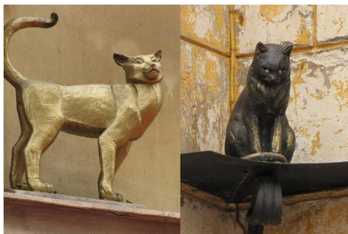
Памятник мяукающей дивизии

Известно, что во время Блокады голодающие жители Ленинграда вынуждены были есть домашних и уличных животных, в основном, собак и кошек. Однако нередки случаи, когда именно домашние питомцы становились главными кормильцами целых семей. Рассказывают про кота по имени Васька, который не только пережил Блокаду, но и приносил практически ежедневно мышей и крыс, коих в Ленинграде развелось огромное количество. Из этих грызунов люди готовили еду, чтобы хоть как-нибудь утолить голод. Летом Ваську вывозили на природу, чтобы он охотился на птиц. В Ленинграде после войны установили два памятника котам из так называемой «мяукающей дивизии», которая справилась грызунами, уничтожающих последние запасы продовольствия.